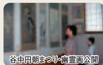
谷中円朝まつり・霊園公園

1月1日 初詣 上旬 七福神詣(谷中七福神詣) 3月下旬～4月上旬 谷中霊園桜 8月1日～31日 谷中円朝まつり(全生庵)